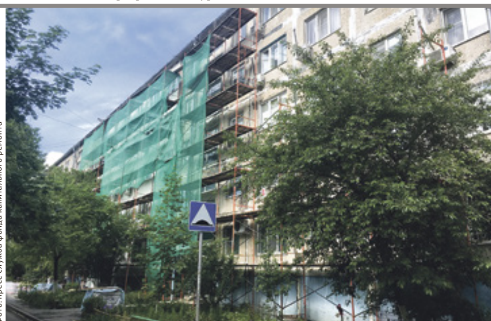
■ Кто-то просил перенести сроки капитального ремонта из-за пандемии, а вот жители дома на ул. Капустина, 28/1 в Ростове ждали его с нетерпением

Стоит учесть, что данная компенсация рассчитывается не от фактической величины взноса на капремонт, которая начисляется льготнику, а в пределах регионального стандарта нормативной площади жилого помещения. Например, в Ростовской области этот стандарт составляет 33 кв. м для одиноко проживающего человека и 42 кв. м на семью из двух человек. Соответственно, одиноко проживающий 80-летний